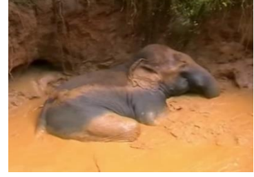
படம் 5. கிராம புறங்களில் இடம் பெறும் நில அகழ்வுகளால் ஏற்படக் கூடிய மற்றும் தொடர்புபட்ட ஆபத்துக்கள்.