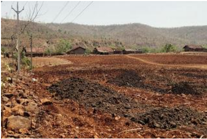
படம் 6. மேல் மண்ணை விவசாயத்திற்கு பயன்படுத்துதல்.