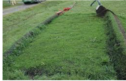
படம் 7. விவசாய நிலங்களில் மண் அரிப்பைக் கட்டுப்படுத்துதல்.