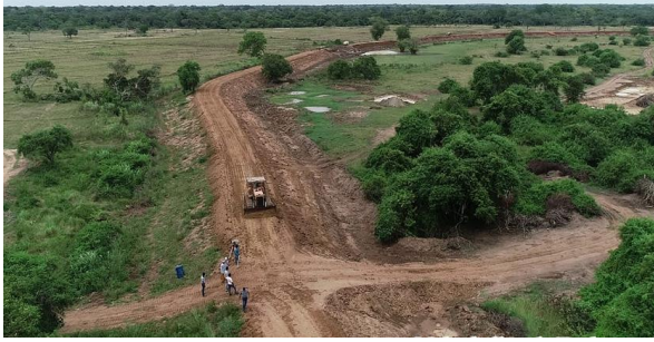
படம் 4. விவசாய பாதைகளை அமைத்தல்