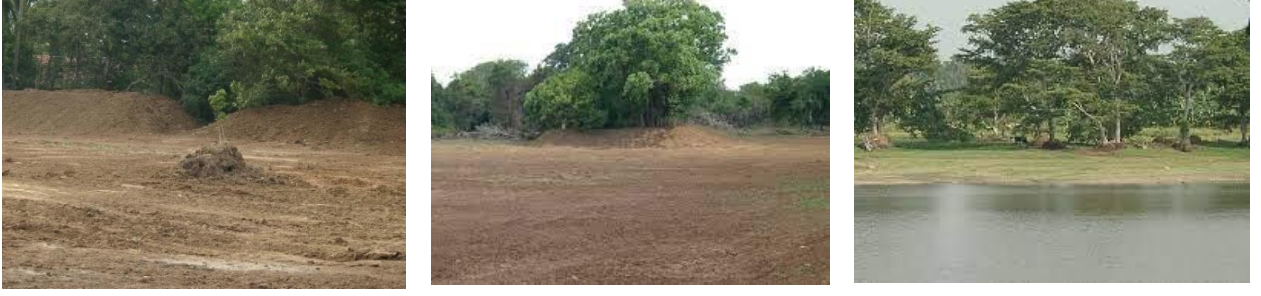
படம் 2. அதிகமாக வெள்ளப் பெருக்கு ஏற்படக் கூடிய பிரதேசங்களில் புதிய வாழிடங்களை உருவாக்குவதற்கு தோண்டப்பட்ட அல்லது தூர் எடுக்கப்பட்ட மண்கள் அல்லது பொருட்கள் பயன்படுத்தப் பட்டுள்ளது