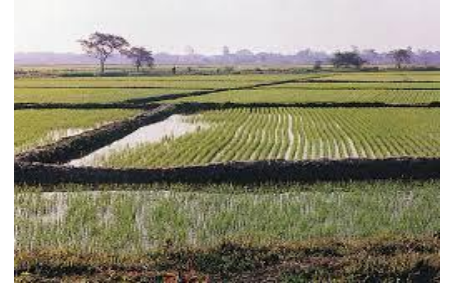
படம் 8. நெல் வயல்களில் வரம்புகள் அமைக்கப்பட பயன்முதுகுத்தப் பட்டுள்ளது.